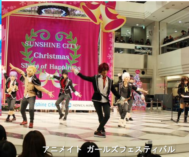
アニメイト ガールズフェスティバル