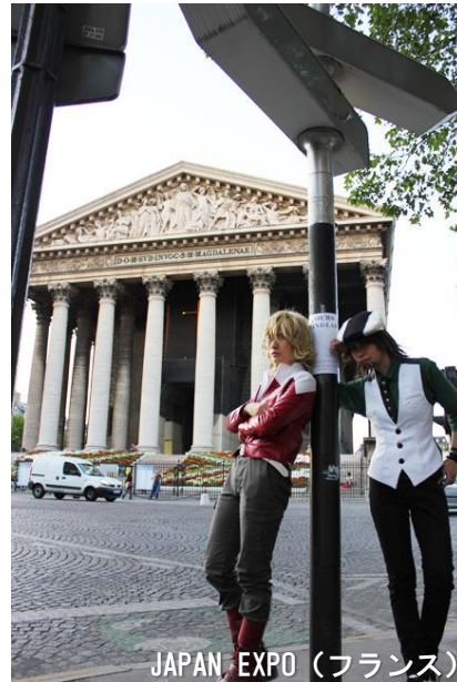
JAPAN EXPO (フランス)