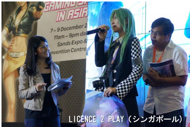
LICENCE 2 PLAY (シンガポール)