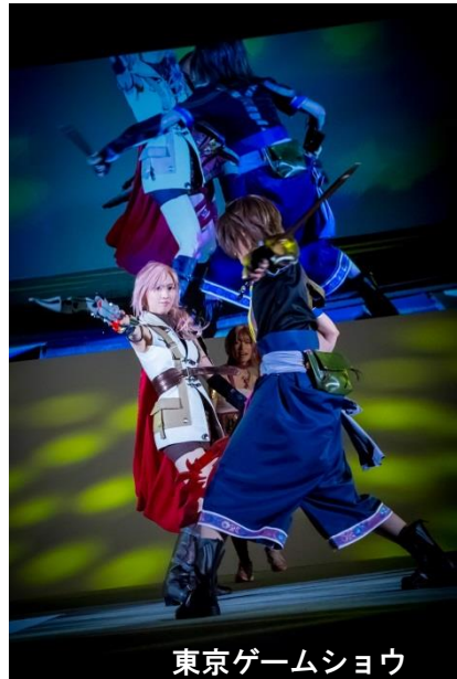
東京ゲームショウ